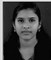
അഞ്ചു എലിസബേത്ത് യോഹന്നാൻ എം.ജി.എം. മാന്തളിർ മാർ ഔഗേൻ പ്രസംഗം ഭദ്രാസനം 1st